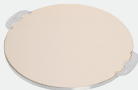
PIEDRA PARA PIZZA 480